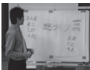
区画整理課職員による特別授業

自然や田畑が少しずつ減ってきて、区画整理に疑問を投げかけていた子どもたちも、市の区画整理課や区画整理組合の方たちの町に対する思いや苦労話を聞いていくなかで、まちづくりについて自分たちなりに考えていくようになりました。