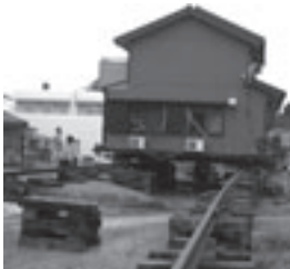
家を動かす「ウツギ家」