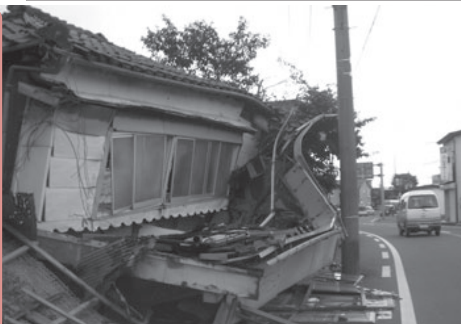
新潟県中越沖地震で倒壊した民家(平成19年7月16日)