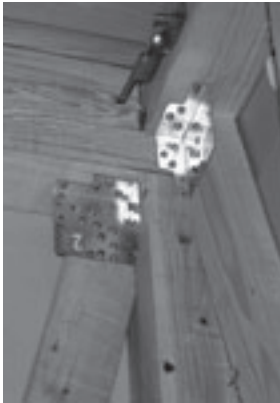
木造住宅耐震改修工事 (すじかいを入れ耐震補強を行う)

実施前に建築指導課に事前相談・補助金交付申請をしてください。※耐震診断実施前に行わないと補助金が受けられません