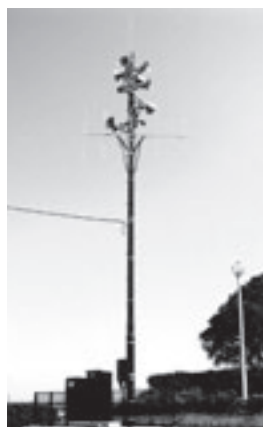
屋外拡声子局 (神野西緑地)

なお、設置予定場所については、電波の受信状況や周囲の建物の状況、伝達範囲などにより変更する場合があります。