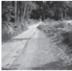
以前は「トトロの森」があった場所

学校の裏側に大きな木々に囲まれたつつそつとした道がありました。子どもたちはちよっぴり怖さを感じながらも「トトロの森」と呼び、親しみを感じていた場所でした。それがある日突然明るく見とおしの良い場所になってしまったのです。