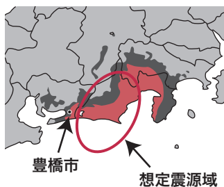
東海地震の想定震源域と想定震度