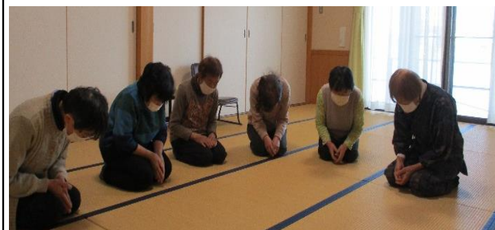
<活動日：第2第4木曜日午後13:30～15:30>

錐体外路系の運動と言ひ、無意識運動です。今日の心身の疲れを明日に持ち越しません!基本的に三つの準備運動があり、毎日自分でできます。