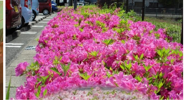
4/28 ミナクル駐車場のツツジ

■新型コロナウイルスの影響により、この3年余りで私たちの生活スタイルや社会の仕組みがだいぶ変わりました。主なものとしては、マスクを着用しながらソーシャルディスタンスを確保することや、リモートワークや宅配サービスなども増えました。そして5月8日から、新型コロナウイルスの感染症法上の分類が、季節性インフルエンザと同等の第5類に移行しました。ミナクルでは、利用者の方々の活動が戻り、マスクを外している方々の笑顔が見えるようになってきました。