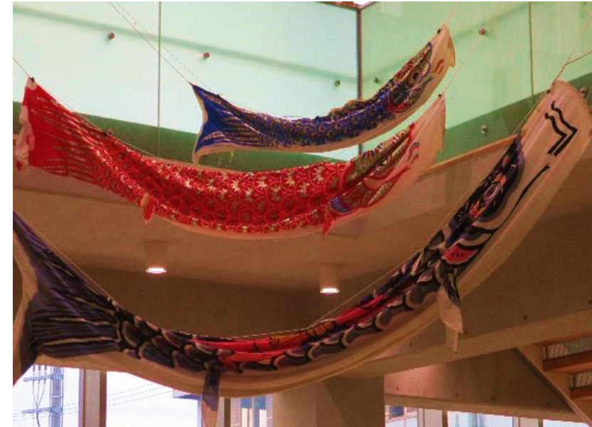
5/5 地域じょうほうひろばのこいのぼり

〒441-8133 豊橋市大清水町字彦坂10-7 http://www.city.toyohashi.lg.jp/17157.htm mail:nanryo@citytoyohashi.lg.jp