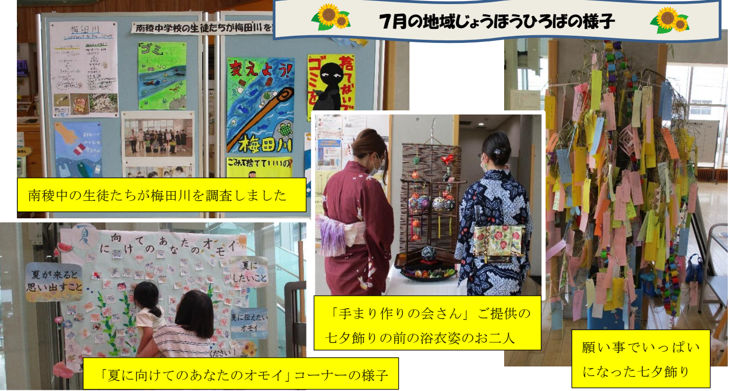
7月の地域しょうほうひろばの様子

〒441-8133 豊橋市大清水町字彦坂10-7 http://www.city.toyohashi.lg.jp/17157.htm mail:nanryo@city.toyohashi.lg.jp