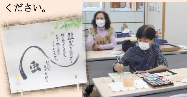
<活動日：毎月第2第4木曜日の午後>