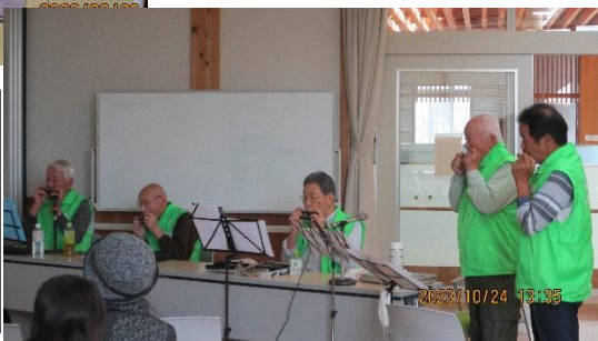
10/24 ミナクルおいでんセミナーで、大清水ハーモニカ倶楽部の皆さんと、懐かしい歌を口ずさみました。