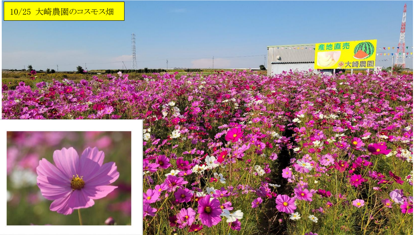
10/25 大崎農園のコスモス畑

〒441-8133 豊橋市大清水町字彦坂10-7 http://www.city.toyohashi.lg.jp/17157.htm mail:nanryo@city.toyohashi.lg.jp