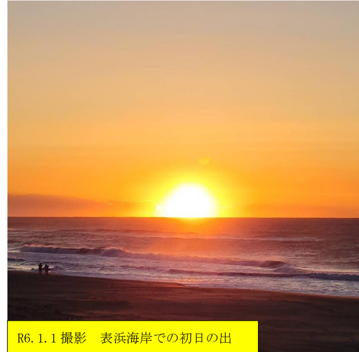
R6. 1. 1 撮影 表浜海岸での初日の出

〒441-8133 豊橋市大清水町字彦坂10-7 http://www.city.toyohashi.lg.jp/17157.htm mail:nanryo@citytoyohashi.lg.jp