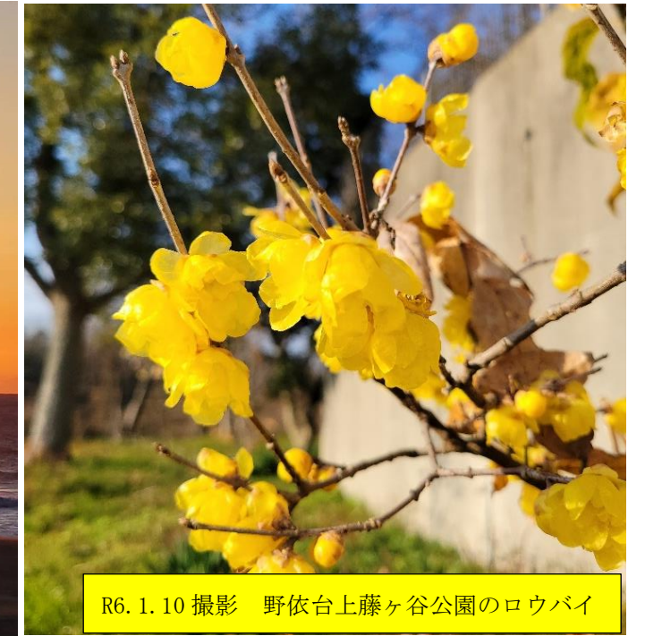
R6. 1. 10 撮影 野依台上藤ヶ谷公園のロウバイ

■ミナクル通信 1月号で、過去の「辰年」では大きな出来事が起こっていると記載しましたが、1月1日年始早々、石川県能登半島は最大震度7の大地震に襲われてしまいました。道路の寸断、停電・断水、物資不足、孤立状態などに併せて、降雪と厳しい寒さにより大切な日常が失われてしまいました。被災された方々に心よりお見舞い申し上げますとともに、1日も早く復旧・復興され、平穏な生活を取り戻せるようお祈り申し上げます。 ■また、約2年間続いているロシアによるウクライナ侵攻。皆さん方には衝撃疲れが出てきているかもしれませんが、現在両軍の死者数は30万人超、そして昨年10月から始まったイスラエル軍とハマスの戦闘におきましては、死者数2万5千人超とされています。このような暗いニュースばかりでは、期待する輝かしい「辰年」の一年が危惧されます。