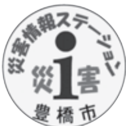
災害情報ステーションに貼られるステッカー

各ステーションからは、災害時に河川、道路、家屋の被害状況などの情報を災害対策本部へ提供していただくとともに、災害対策本部の情報をステーションにも伝達す