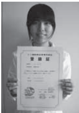
エコ通勤優良事業所認証登録証