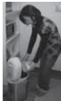
生ごみ処理機を使用するようす