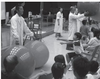
実験ショーのようす

とき: 8月1日(日)午後0時50分・2時20分(各30分) ところ: 視聴覚教育センター 対象: 年長児～中学生と保護者 内容: 光に関するさまざまな楽しい実験ショー。ふしぎな科学体験もできます 講師: 豊橋エコサイエンスクラブ 定員: 240人(先着順)