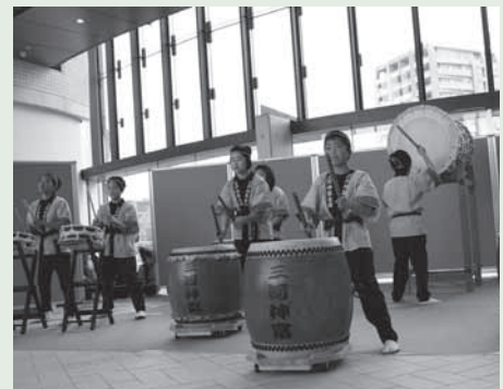
ここにこ夏祭り 三河神富太鼓