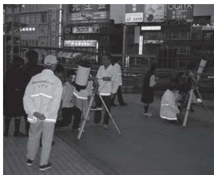
特別観望会のようす

とき: 8月13日(金)午後7時30分～9時(天候不順の場合14日(土)) ※延期・中止のお知らせは、当日午後3時以降にホームページ( http://www.toyohaku.gr.jp/chika/ )、電話で確認できます ところ: 地下資源館屋上 対象: どなたでも(中学生以下は保護者同伴) 内容: 西の空で輝く細い月、金星・火星・土星、夏の代表的な星座を天体望遠鏡や双眼鏡で観望します 持ち物: 懐中電灯、あれば双眼鏡・星座早見盤