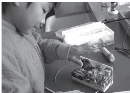
ラジオ製作のようす