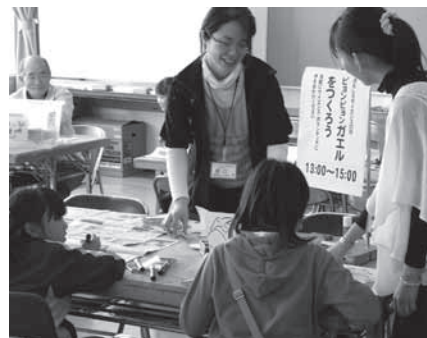
工作を楽しむようす

とき: 7月25日(日)午後1時～3時(随時参加可) ところ: 視聴覚教育センター 内容: 「水と風」をテーマに、サイエンス・ボランティアといっしょに「風車」や「浮沈子」などのかんたんな工作や科学あそびを体験します