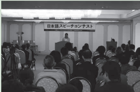
スピーチコンテストのようす

テーマ 自由 参加資格 日本語が母国語でない市内在住の小学生以上 部門/時間 小・中学生の部/3分以内(約800字)、高校生以上一般の部/5分以内(約1千字) 審査方法 第一次書類審査合格者を対象に、フェスティバル会場でのスピーチを審査します その他 このコンテストは「東三河日本語スピーチコンテスト」(来年1月16日開催)の予選会も兼ねます 応募方法 原稿(原則として日本語※ローマ字も可)と申込書を豊橋市国際交流協会