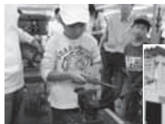
親子でものづくり体験

「バイクのふるさと浜松」は、バイク発祥の地であり、バイク産業が地域の主要産業でもある浜松市ならではのイベントです。今年で8回目を迎え、毎年3万人を超える人が訪れます。街中から会場まで白バイ隊を先頭におよそ100台のバイクによる「交通安全宣言パレード・ラン」に始まり、家族みんなで楽しめるイベントがもりだくさんの2日間。今年は浜松市美術館、浜松市博物館でも関連企画展が8月29日(日)まで開催されています。見て、触れて、バイクを通じて浜松の魅力を体験してください。※イベントは天候などにより変更する場合があります。詳しくはホームページ( http://www.bike-furusato.net )参照。