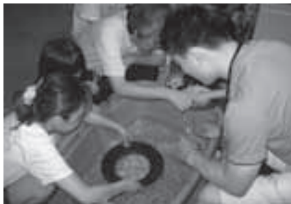
「わんがけで宝石をさがそう」のようす

とき: 8月13日(金)～15日(日)午前9時30分～11時(随時参加可) ところ: 地下資源館(大岩町字火打坂) 内容: サイエンス・ボランティアの指導で、水の力を使って鉱物をより分ける方法を体験します。小さな鉱物のプレゼントあり 参加料: 無料 申し込み: 不要 問合せ: 地下資源館(☎41・2833)