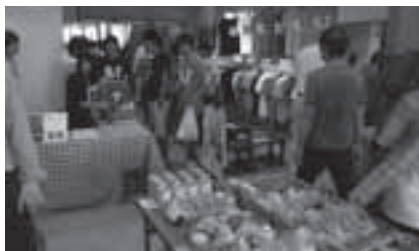
チャレンジショップのようす

とき: 8月8日(日)～28日(土)(水曜日、8月12日・13日を除く)午前10時～午後7時 ところ: コンチェルトタワー豊橋向いの店舗(広小路二丁目) 内容: 市内大学の学生が中心となって店舗を運営するほか、さまざまなイベントを開催します 問合せ: 商業観光課(☎51・2425)