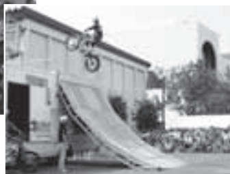
バイクシンクロ演技デモンストレーション