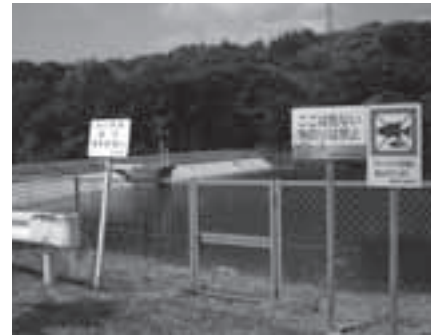
ため池での事故に注意