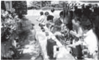
動物慰霊祭のようす

とき: 9月4日(土)午後2時~2時30分(受け付けは午後1時30分) ※小雨決行 ところ: 斎場動物慰霊碑前(飯村町字北池上) 対象: 市内在住で動物の供養をする方 その他: 写真供養も行います。お車で来場した場合、途中退場はできません 問合せ先: 豊橋市獣医師会(☎88・1000)、生活衛生課(☎39・9127)