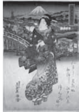
美人東海道日本橋 深斎英泉画

とき: 9月11日(土)～10月3日(日)午前9時30分～午後5時(月曜日休館。9月20日は開館し、翌日休館) ところ: 二川宿本陣資料館(二川町字中町) 内容: 二川宿本陣資料館が所蔵する浮世絵の中から、北斎・広重・豊国・国芳・英泉などの浮世絵師が描いた東海道の浮世絵を展示します 入館料: 一般400円、小・中・高校生100円 問合せ: 二川宿本陣資料館(☎41・8580)