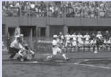
昨年の女子ソフトボールリーグのようす