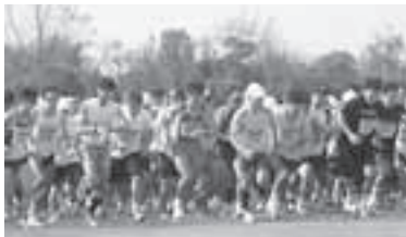
昨年の豊橋みなとシティマラソンのようす

とき: 11月14日(日)午前10時30分 部門など: 右表 コース: 総合スポーツ公園(神野新田町字ユノ割)ー六条潟大橋ー神野西町方面(折り返しコース) 申し込み: 10月19日までにシティマラソンは次の①～③の方法で申し込んでください。①募集要項に付属の郵便振込取扱票で参加料を振り込む②直接、市役所スポーツ課(東館11階)または豊橋市体育協会(岩田運動公園内)③ホームページ( http://runnet.jp/ )。さわやかジョギングは、返信先明記の往復はがき(1枚につき5人まで)で住所、氏名、年齢、性別、生年月日、昼間の連絡先を豊橋みなとシティマラソン実行委員会事務局(〒440-8501住所不要)※募集要項は市内各スポーツ施設、スポーツ課で配布中 その他: お楽しみ抽選会あり。さわやかジョギングは順位を競いません 問合せ先: 豊橋みなとシティマラソン実行委員会事務局(ス