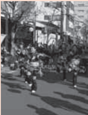
華やかな衣装が通りにあふれる

2日間にわたり駅前大通りや広小路通り、豊橋公園一帯を主な会場として全市を挙げて盛大に繰り広げられます。市民のつくる市民のまつり、楽しさいっぱいの豊橋まつりへみなさんでお越しください。詳しくは、商業観光課などで配布中の豊橋まつりガイドブックをご覧ください。