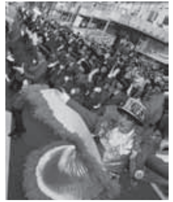
昨年のパレカの様子