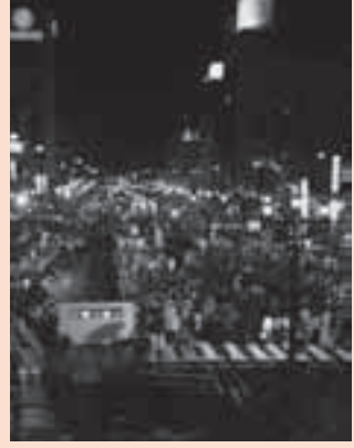
まちなかを埋め尽くす総おどりの人波