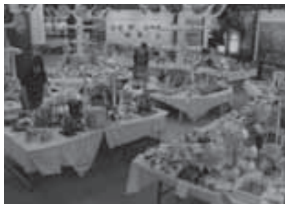
資源をくらしに生かす創意工夫展の様子

とき: 10月9日(土)～11月28日(日)(月曜日休館。祝・休日の場合は開館し、翌日休館) 午前9時～午後4時30分 ところ: 地下資源館(大岩町字火打坂) 内容: 市内小・中学生の応募作品を中心に、身近な不用品をリユース・リフォームした作品を展示します。10月9日午前10時より優秀作品の表彰式を行います 観覧料: 無料 問合せ先: 地下資源館(☎41・2833)