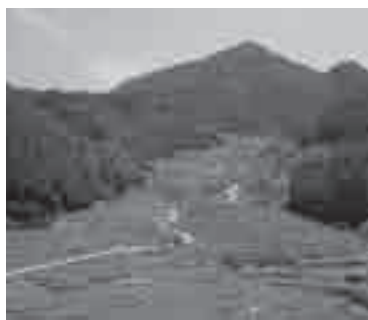
四谷千枚田(新城市)

東三河地域は、太平洋や三河湾、奥三河の山々に囲まれ、多様な生物が数多く生息しており、また、清流豊川が地域を縦断することで、生態系の連続性が見られます。 今回は、豊橋市をはじめ東三河の方々に東三河地域の貴重な生物多様性をぜひ堪能していただきたく、「生物多様性交流フェア」での展示を再現