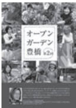
第2回オープンガーデン豊橋パンフレット

対象: 市内在住でガーデニングをやっている方 配布部数: 150部 (申込順。1家族1部) 申し込み: 1月31日(必着)までに住所、氏名、電話番号、第1回パンフレットも希望する場合はその旨を明記し返信用の切手120円分(第1回パンフレットも希望する場合は140円分)を、