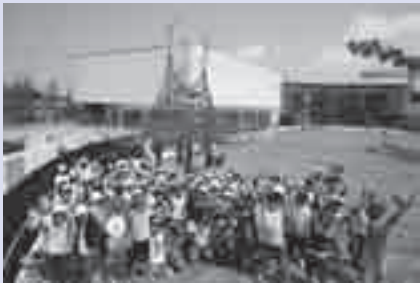
こども未来館ここにこ

応募規定 キャラクター(正面・側面)のデザイン・名前・簡単な説明。1人1作品。自作未発表の作品に限る。色数は自由。作品にかかる諸権利は市に帰属します。作品は返却しません。賞 最優秀賞1点/3万円と賞状、優秀賞2点/1万円と賞状※高校生以下は相当額の図書カードと賞状 発表 本紙8月1日号で発表(入賞者には直接連絡)。また、着ぐるみを製作し、豊橋まつりで発表予定 応募方法 5月31日(必着)までに郵送またはEメールで住所、氏名(フリガナ)、年齢、勤務先(児童・生徒の場合は、学校名と学年)、電話番号、作品(郵送の場合はA4サイズの縦長白色用紙、または作品データ(形式はJPEG、PDF、CS2以下のイラストレーター)を保存したCD-RなどとA4サイズに出力したもの。Eメールの場合はファイルサイズ1MB以下にした作品データを添付)を、こども未来館(〒440-0897 松葉町三丁目1-97 character@coconico.jp) ※詳細は、こども未来館などで配布のチラシ、ホームページ( http://www.coconico.jp/ )参照