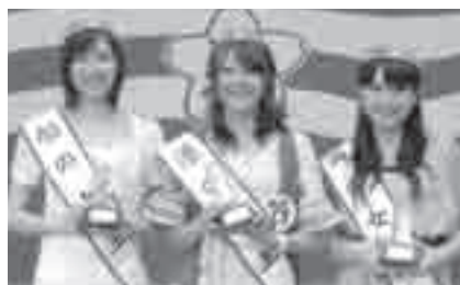
昨年のミスみなと

活動内容: 「みなとフェスティバル」「豊橋まつり」など、市内で開催される各種行事に参加 募集人数: 3人(港・船・海の女王) 応募資格: 東三河に在住・在学・在勤で、6月26日現在で18歳～28歳(高校生を除く)の健康な未婚の女性 審査: [1次]6月14日書類審査選考[2次]6月26日面接/ホテル日航豊橋(藤沢町) 賞: 各賞金10万円とオーストラリア(シドニー、メルボルン)旅行(予定)、ホテル日航豊橋ペア宿泊券(食事付)、参加記念品など 応募方法: 6月11日(消印有効)までに応募用紙、写真1枚(6か月以内に撮影したもの)を東愛知新聞社事業部(〒441-8666新栄町字鳥瞰62) ※応募用紙は東愛知新聞社、豊橋商工会議所、市役所案内所などで配布中 問合せ先: 東愛知新聞社事業部(☎32・3111)、豊橋みなとフェスティバル実行委員会事務局(商工会議所内 ☎53・7211)、港湾活性課(☎34・3710)