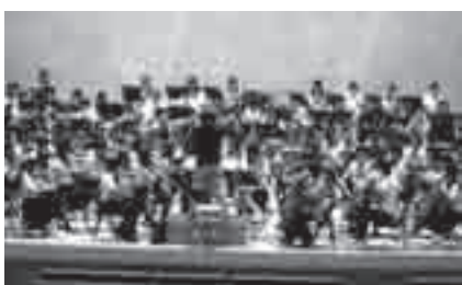
豊橋青少年オーケストラキャンプのようす

とき: 7月20日(水)～23日(土)午前9時～午後5時30分(予定) ※7月20日のみ午後4時から開始(予定) ところ: ライフポートとよはし(神野ふ頭町) 対象: 東三河地域在住・在学の、中学1年～高校3年生に相当する青少年で、Aオーケストラ、Bオーケストラどちらかに参加し、課題曲を演奏でき、原則4日間全てに参加できること ※Aオーケストラは課題曲①が演奏できれば可 内容: 2つのオーケストラに分かれ、ドイツから招いた一流の音楽家による指導を受け、コンサートを行います 課題曲: Aオーケストラ/①ブラームス「交響曲第1番より第4楽章」②「ハンガリー舞曲第5番」③グリーグ「ピアノ協奏曲より第1楽章」、Bオーケストラ/「驚愕シンフォニー」(ハイドン「交響曲第94番第2楽章」より編曲) 募集パート: A・Bオーケストラともにフルート、オーボエ、クラリネット、ファゴット、ホルン、トランペット、トロンボーン、パーカッション、ヴァイオリン、ヴィオラ、チェロ、コントラバス 講師: 浮ヶ谷孝夫さん(ブランデンブルグ国立管弦楽団フランクフルト首席客演指揮者)、ブランデンブルグ国立管弦楽団フランクフルト首席ソリストほか 定員: 250人(定員を超えた場合は選考) 参加料: 1,000円(7月23日開催のコンサートのチケット1,000円分進呈) その他: 詳細はホームページ( http://www.city.toyohashi.aichi.jp/bunka/ )参照 申し込み: 6月17日までに申込書を文化課(〒440-8501住所不要 ☎51・2873) orchestra-camp@city.toyohashi.lg.jp ) ※申込書は文化課、ホームページで配布中