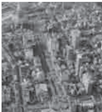
空から見たまちなか

豊橋市は、まちなかの活性化のためにさまざまな取り組みを進めています。まちなかの活性化について3つのギモンに答えます。