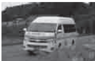
コミュニティバス「柿の里バス」

2千円、子ども用(50円券22枚綴り) 1千円 その他 柿の里バスポート(1か月券1千円)があれば、どの区間でも1乗車100円で乗車できます ※豊橋市 福祉回数乗車券も利用可