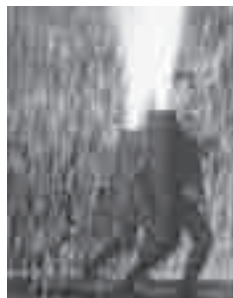
放揚される手筒花火

■羽田八幡宮境内(花田町字斉藤) とき/内容: 10月1日(土)午後2時/餅投げ、午後4時/手筒・大筒・乱玉。10月2日(日)午前10時/乙女舞・浦安舞・獅子舞奉奏 ■松葉公園(萱町) とき/内容: 10月2日(日)午後3時/餅投げ、午後4時/手筒・大筒・乱玉 [共通事項] 問合先: 羽田八幡宮(☎31・7968)、商業観光課(☎51・2430)