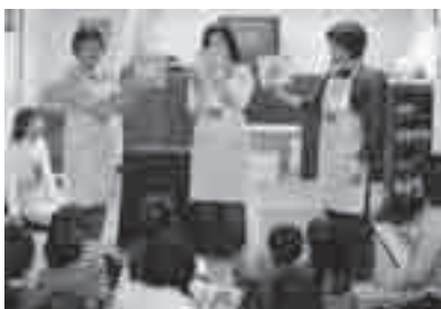
読み聞かせのようす