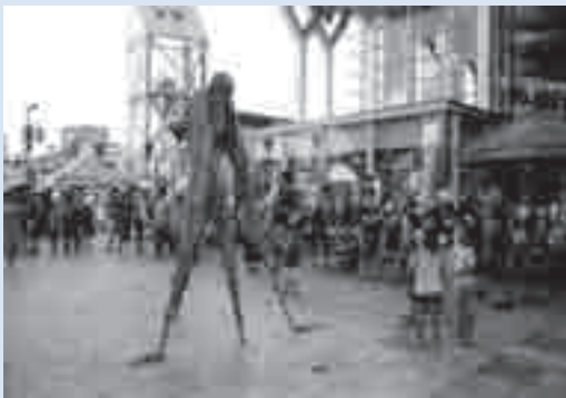
全長3メートルを越す体で自在に動き回る Dark Krakou