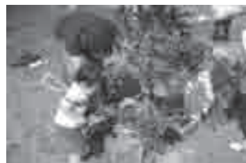
記念植樹のようす

誕生、入学、結婚などの節目に、市内の庭などに植樹を希望する方を募集します。 受付・配布期間: 通年 対象: 市内に植樹できる方 樹種: サザンカ、ハナミズキ、ヤマモモなど高さ80cm程度の樹木12種から選択 本数: 150本(申込順。1人10本まで) 費用: 1本500円 申し込み: 費用を豊橋みどりの協会(大岩町字大穴☎41・7400)、市役所公園緑地課(東館9階☎51・2650)