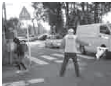
地域で子どもを見守る「子ども見まもり隊」の活動のようす