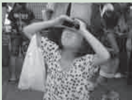
日食グラスで日食を観察するようす

下資源館屋上(大岩町字火打坂) 対象 どなたでも(中学生以下は保護者同伴) 内容 日食グラスなどで金環日食を観察します。日食グラスは100個程度用意します 定員 200人(申込順) 参加料 無料 持ち物 筆記用具、あれば日食グラスなど 申し込み 5月6日午前9時から視聴覚教育センター ☎41・3330