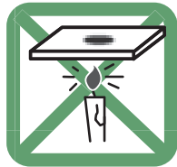
ススをつけたガラス