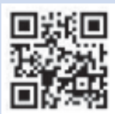
登録用Eメールアドレス QRコード

登録方法 登録用Eメールアドレス( anzen-anshin.net )に空メールを送信し、返信されたメールの指示に従って設定してください。左記のQRコードも利用できます。設定方法などの詳細は、コールセンター ☎0120・670・970 ※土・日曜日、祝・休日を除く午前9時～午後6時)、お近くの携帯ショップ、またはホームページ ( http://www.city.toyohashi.aichi.jp/safety_life/mail.html )参照