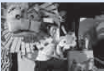
お花のハナツクの物語