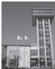
ポートインフォメーションセンター「カメラリア」

とき: 3月26日(火)午前9時15分、午後1時15分(各2時間) 集合・解散: カメラリア(神野ふ頭町) 対象: 小学生以上(小学生は保護者同伴) 内容: 花王(株)豊橋工場でのスキンケア製品製造ラインなどの見学 定員: 各30人(抽選) 参加料: 無料 申し込み: 3月15日(必着)までに返信先明記の往復はがきで参加者全員(1枚につき6人まで)の住所・氏名・年齢・電話番号を港湾活性化課(〒441-8075 神野ふ頭町3-29 ☎34・3710)