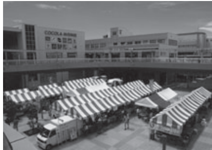
まちなかマルシェのようす

とき: 2月23日(土)午前10時～午後4時(雨天決行) ところ: 豊橋駅南口駅前広場(渥美線新豊橋駅前) 内容: 旬の野菜や果物をはじめ、三河湾の海苔、野菜煎餅、焼き菓子、地元グルメなど、こだわりの一品を販売します 問合せ: まちなか活性課(☎55・8101) http://machinakamarche.sitemix.jp/