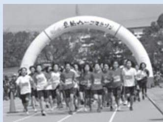
昨年の穂の国・豊橋ハーフマラソン