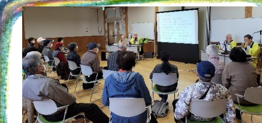
3/27 「歌とハーモニカのつどい」の様子