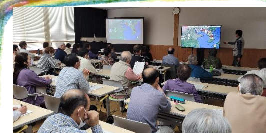
4/16 歴史シンポジウム「古代への誘い」の様子