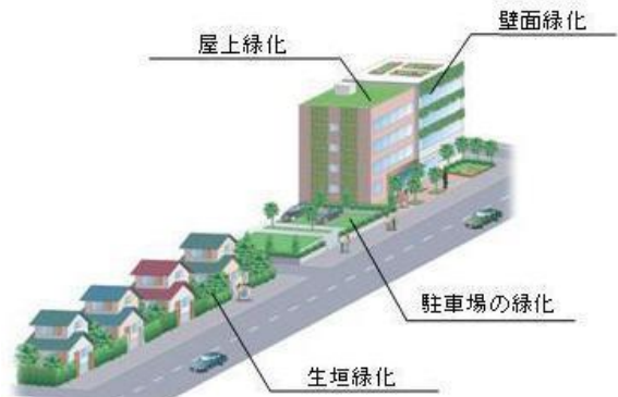
愛知県 HP「あいち森と緑づくり事業」より引用