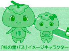
「柿の里バス」イメージキャラクター