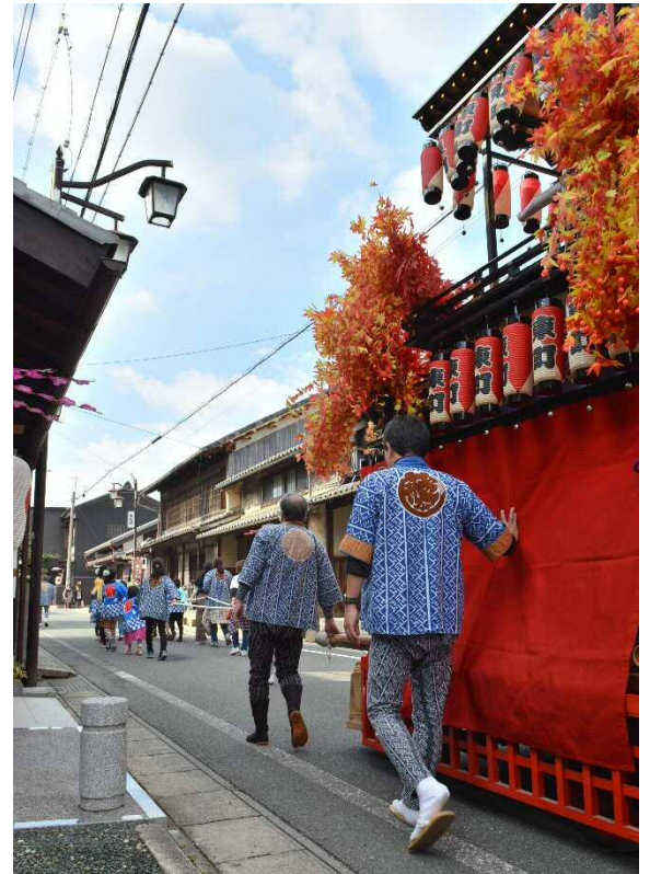
▲ 旧街道に繰り出す二川八幡神社例大祭の山車

今後もテーマに沿った活動を皆様と行っていきたくと思っていますので、ご理解、ご協力をよろしくお願いいたします。まちづくり会の活動への賛同者も募集しています。