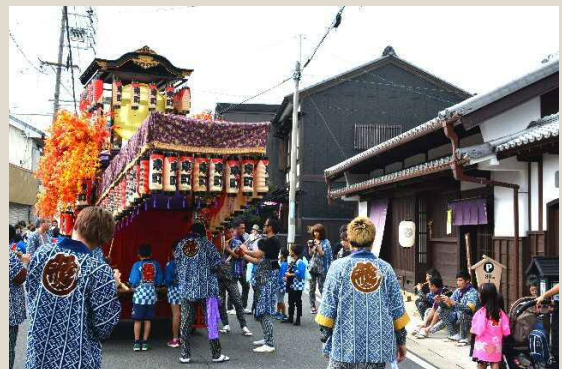
▲ 落ち着いたまち並みを背景に山車が映える！ (上左：中町、上右：新橋町、下：東町)