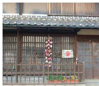
▲これまでの旧街道沿いの吊るし飾り