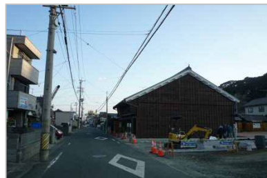
▲旧街道からの大橋屋の様子。脇本陣跡の隣地もポケットパークとして整備中