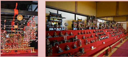
▲昨年のひなまつりの様子