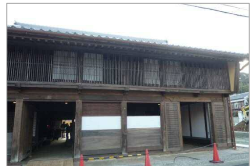
▲ほぼ工事が終わった大橋屋。旅人も2階の座敷の格子越しに街道を眺めたかも(?)

* 景観形成地区内で工事予定の方は助成金の制度がありますので豊橋市都市計画課までご相談下さい。☎51-2616