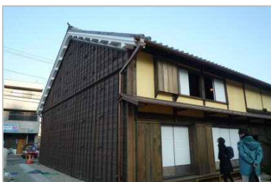
▲旧街道と反対側の2階の壁は温かみのある薄い黄色の漆喰塗

東海道 36 番目の宿場町、赤坂宿にある大橋屋（豊川市指定文化財）は、江戸時代からの旅籠の佇まいが残された旧東海道唯一の宿として、平成 27 年まで営業していました。豊川市により保存整備がすすめられ、来年度、一般公開が予定されています。できるだけ旧部材を使用し、部材の再利用にあたっては伝統技法である金輪継ぎを行って建設当初の姿を目指しつつ、一部特徴のある明治時代の痕跡は残しています。公開が楽しみです。