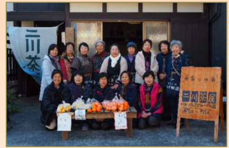
▲二川茶屋のスタッフです