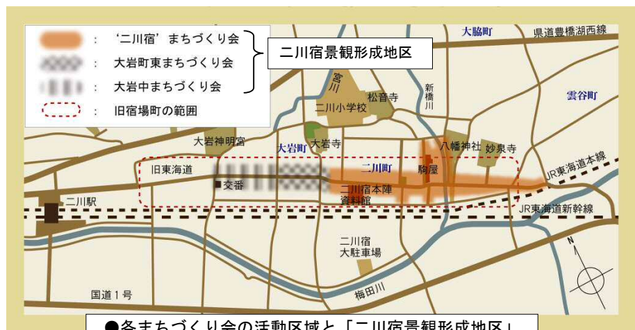
●各まちづくり会の活動区域と「二川宿景観形成地区」

「家を建て替えたいんだけどどうすればいいの？」、「外壁の塗装をしたいけどどんな色にしたらいいの？」、「助成金を活用するにはどうしたらいいの？」など、景観形成地区内で工事をお考えの方、まずは市役所都市計画課（TEL：51-2616）へどうぞお気軽にご相談ください！