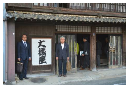
▲江戸時代から近年まで営業していた旅籠屋大橋屋を見学しました。一般公開に向けて今後整備が行われる予定。