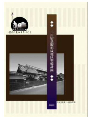
▲今回改訂された「二川宿景観形成地区整備計画」

「整備計画」では、先行2団体である‘二川宿’まちづくり会と大岩町東まちづくり会の協定のまち並み基準の内容がそのまま位置付けられています。4月に締結された「大岩中まちづくり協定」のまち並み基準も先行2団体と同じものとなったため、今回の改訂では、まち並み基準の内容は現行のままです。引き続き協定を守って景観整備を進めていきましょう！