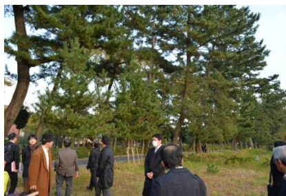
▲国天然記念物の「御油の松並木」。地元愛護会や住民の手により江戸時代からの風景が保存されています。