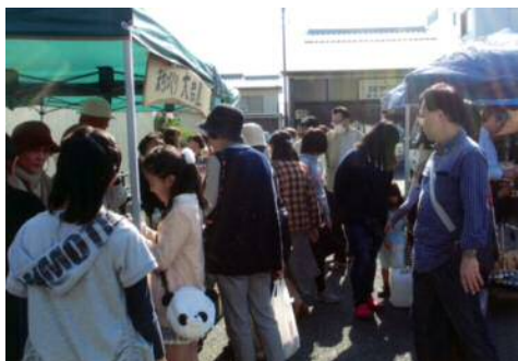
▲たくさんのお客さんでにぎわいました。

大岩町東まちづくり会は、今年も11月6日(日)に開催された二川宿本陣まつり「大名行列」に合わせて「まちづくり大岩屋」を出店しました。大名行列はここ数年雨天の中での開催でしたが、今年は天候に恵まれ大変なにぎわいとなりました。大岩屋では手づくりの木工雑貨や布製品、苔玉などを販売し、大盛況でした。新春には、街道沿いを彩る正月用の花飾りを検討中です。