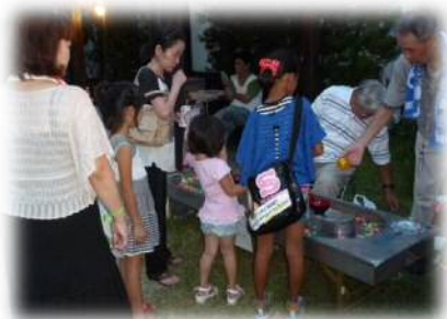
▲スーパーボールすくい