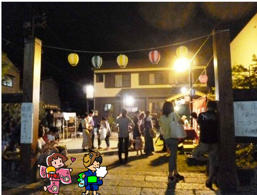
▲順延するも、今年もたくさんの方が来てくれました。