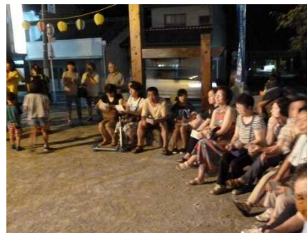
▲盛り上がったビンゴゲーム