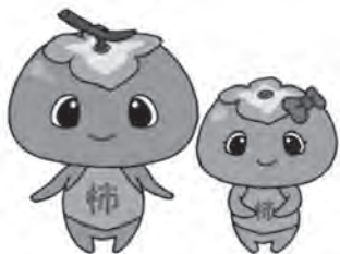
柿の里バスマスコット

▲: 予約運行区間 ★: 停車順序(産直プラザ石巻→和田辻東) ●: 短絡ルート運行区間