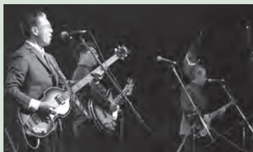
エキサイティング・シニア・カーニバルのようす