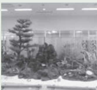
昨年度の正月寄せ植え展示物

年末には一足早く正月気分を味わうことができますので、植物園の温室に、ぜひお越しください。