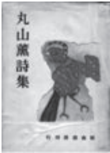
「闇」が掲載された「丸山薫詩集」