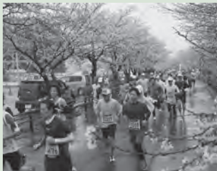
昨年の穂の国・豊橋ハーフマラソンのようす

〈豊鉄バス「牛川金田線」〉 豊橋駅前発下り(午前9時43分~10時38分)、金田住宅前発上り(午前9時55分~10時50分)