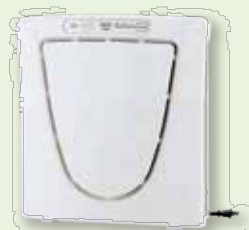
Ⓓ 空気清浄機 (10名)