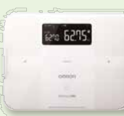
Ⓕ 体重体組成計 (5名)