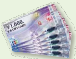
Ⓔ JCBギフトカード1万円分 (5名)