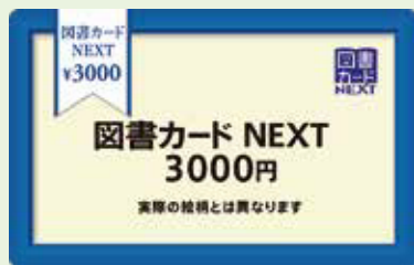
図書カード3,000円分 (5名)