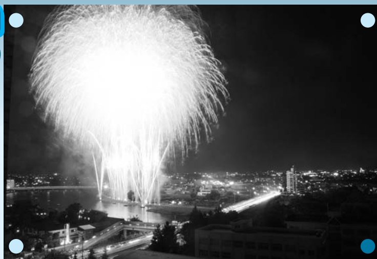
Lanzamiento de Fuegos Artificiales