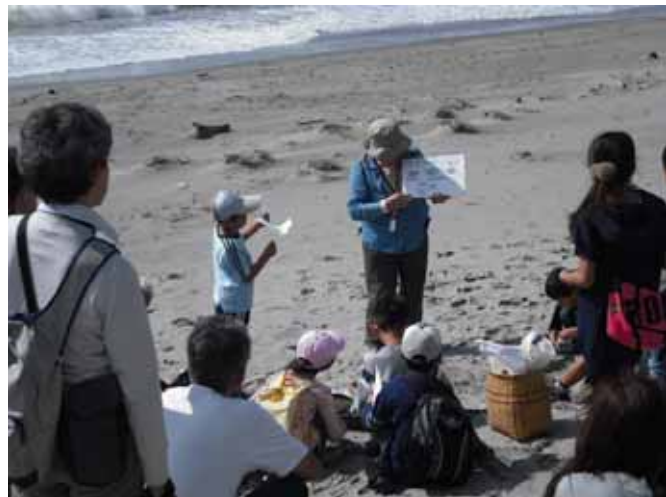
表浜での自然観察会