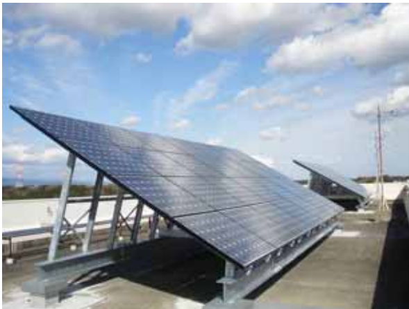
太陽光発電システム

太陽光発電システムなどの環境に配慮したエネルギー利用や自動車と公共交通、自転車、徒歩などをかしく使い分けるライフスタイルの推進など、地球温暖化対策を進め、二酸化炭素の排出が少ない低炭素社会*を実現することにより、恵まれた環境を将来の世代に継承し、地球環境の保全に寄与することを目指します。