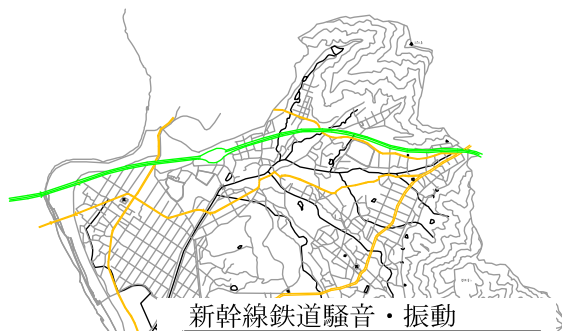
新幹線鉄道騒音・振動