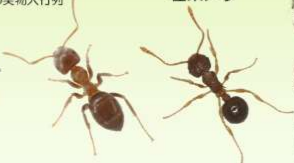
トビイロケアリ （約8倍）