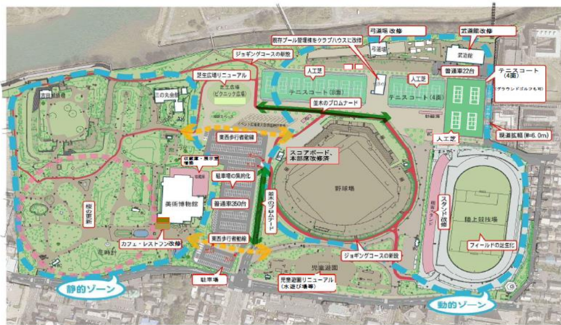
H27.12.22 豊橋公園整備計画図（案）

なお今回の事業提案の内容により、公園の整備計画を一部変更することを予定しています。