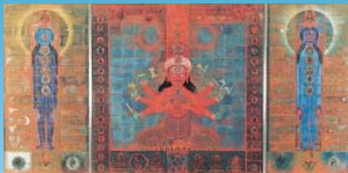
タントラ考(京都国立近代美術館蔵)

入場料 一般・大学生800円(600円) 小・中・高生400円(300円) ( )内前売りまたは20人以上の団体料金。前売券は美術博物館、二川宿本陣資料館、市役所じょうほうひろば、市民文化会館で販売中。豊橋市敬老パッセージ・身体障害者手帳・療育手帳・精神障害者保健福祉手帳をお持ちの方は、無料で入場できます