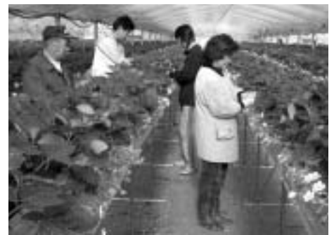
高設ベンチでの作業

昨年の夏には、サラリーマン時代に培った技術を生かして、腰を曲げずに作業ができ、出荷期間も約1か月伸びるといわれている高設ベンチを一人でコツコツ作り上げ、地上栽培との生産の違いを試しているそうです。「イチゴの管理は難しいけれど『継続は力』の言葉どおり、最近ではイチゴの顔がわかるようになってきました。イチゴたちは