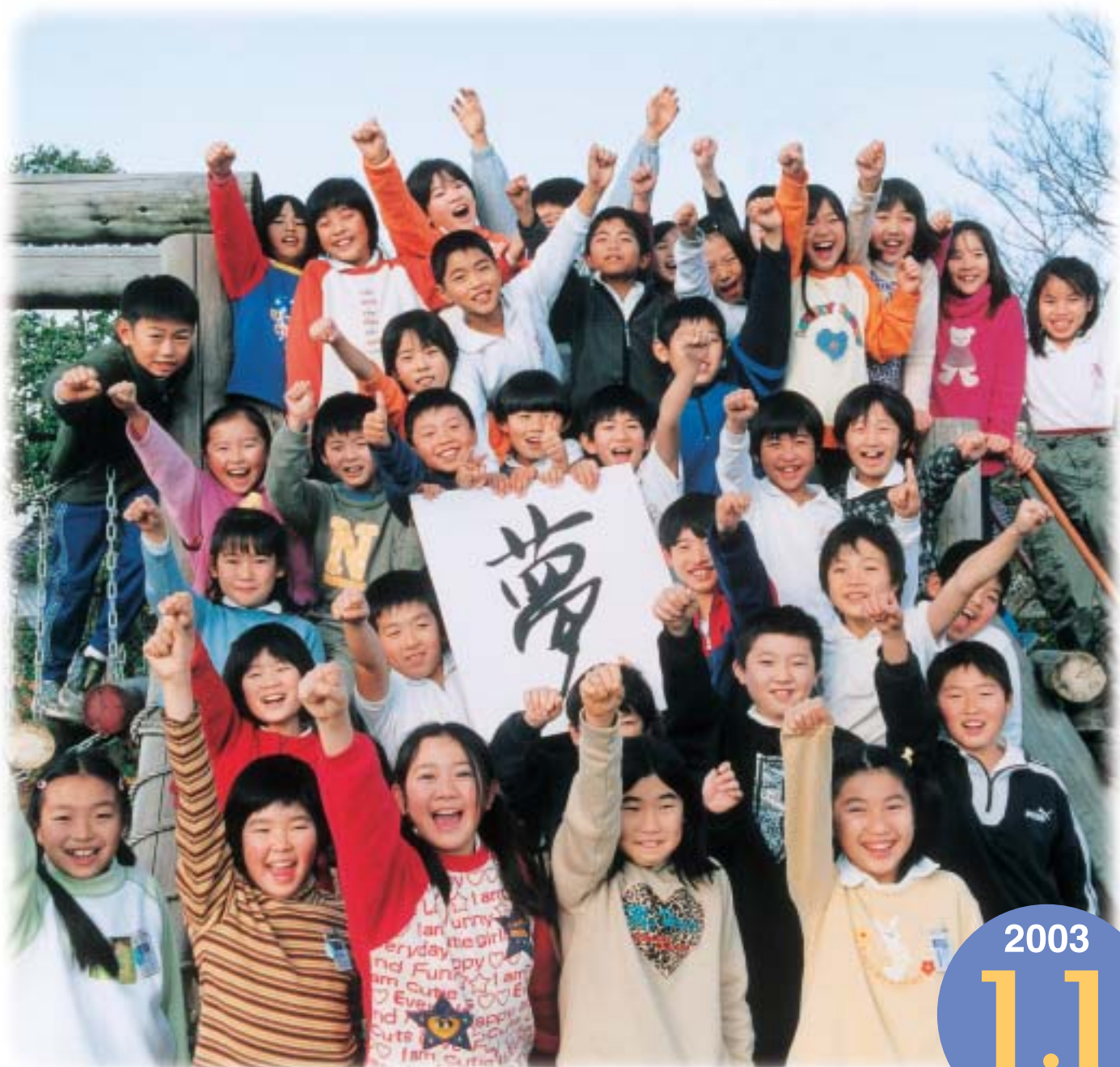
2003年 小柴先生の後輩たちも夢に向かってスタート!(東田小学校)