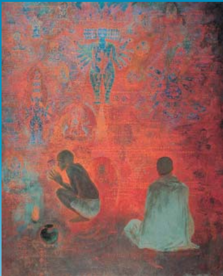
聖界(愛知県美術館蔵)