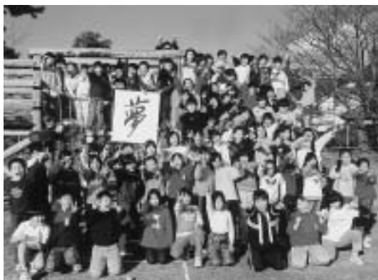
東田小学校4年生の皆さん

名古屋S級シリーズ場外発売『名古屋競輪場』 12月31日(火)、1月1日(祝)・2日(休) 和歌山記念競輪場外発売『和歌山競輪場』 9日(木)・10日(金)・11日(土)・12日(日) 豊橋けいりん(第9回後節) 17日(金)・18日(土)・19日(日) 競輪祭場外発売『小倉競輪場』 23日(木)・24日(金)・25日(土)・26日(日) [早朝前売] 午前7時30分から発売 ケーブルテレビ50chで放映中