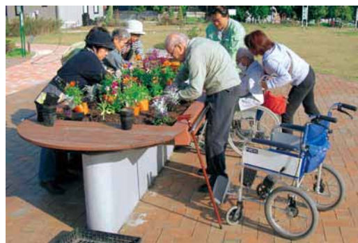
園芸福祉活動（名古屋市ブルーボネット）

園芸療法とは、園芸作業や草花の鑑賞を通して身体や精神機能の維持・回復、生活の質の向上を図る療法です。