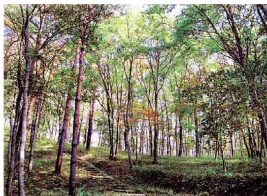
森林セラピーロード「登米ふれあいの森」 宮城県登米町 森林組合

森林セラピーとは、医学的エビデンス（証拠）に裏付けされた森林浴効果のことであり、森林内を散策するなど森林環境を利用して心身の健康維持・増進、疾病の予防を行うことを目指すものです。現在、静岡県河津町や宮城県登米町など全国44ヶ所の森が森林セラピー基地等として認定されています。