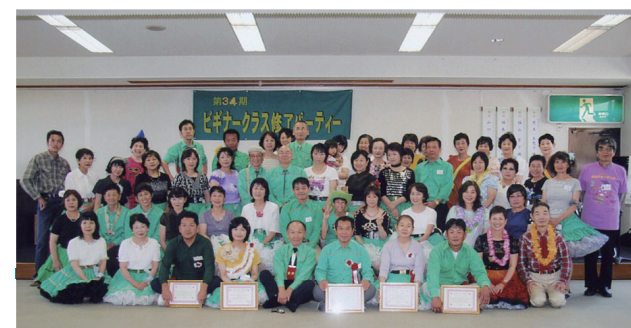
ピギナークラス修了パーティーを開催。この日卒業されたのは修了証書を手にしている5名。卒業後は土曜日の例会はもちろん、さまざまなパーティーに参加し、スクエアダンスを楽しみます。