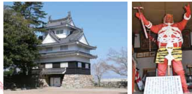
豊橋観光ボランティアガイドの会