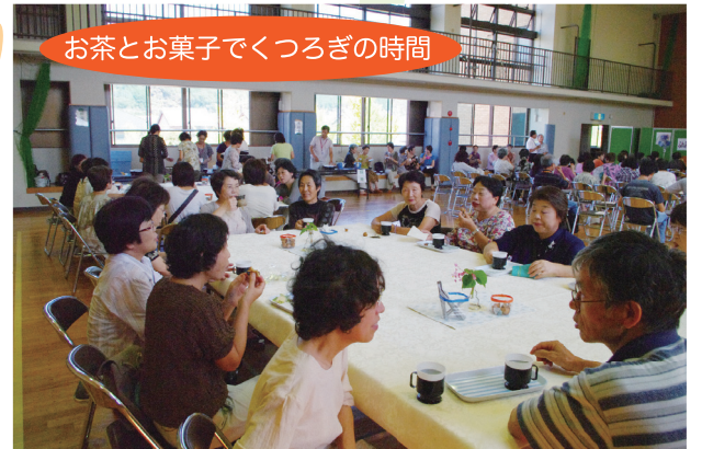
お茶とお菓子でくつろぎの時間

1月に4月~12月に演奏等をして下さる皆さんを募集します!詳しくは東陽地区市民館までお問い合わせ下さい。