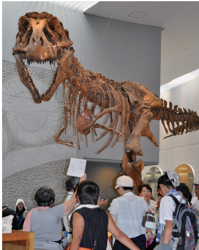
常設展ガイドツアーの様子