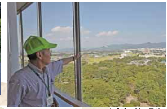
市役所13階の展望室