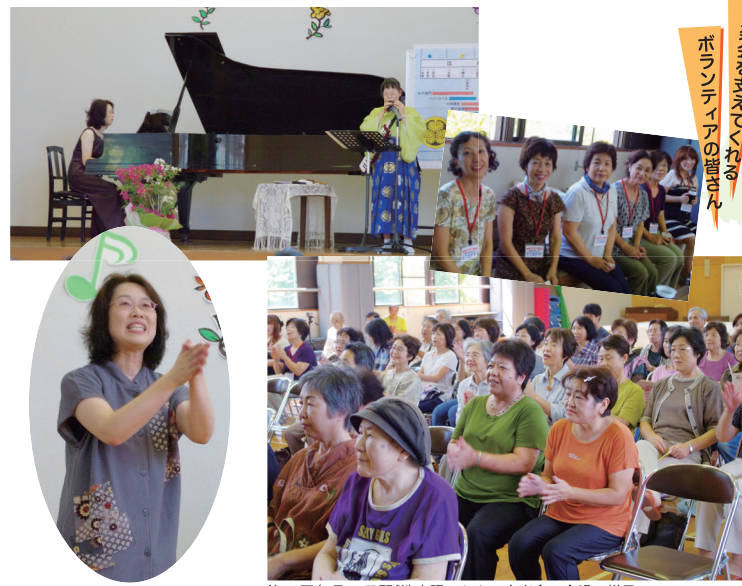
第89回(9月22日開催)東陽ふれあい音楽会の会場の様子