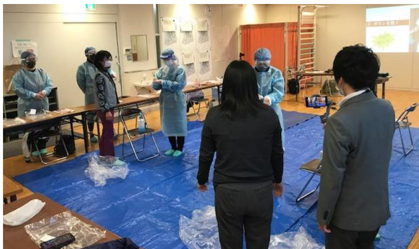
入所・短期入所事業所連絡会の様子

④新型コロナウイルス感染症への対応について（手袋・ゴーグル・ガウン等着脱の実戦訓練）