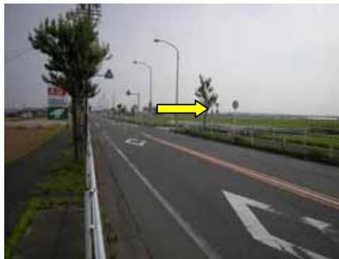
豊橋駅方面からは、右に曲がります。