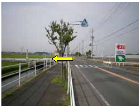
明海町・大崎町方面からは、左に曲がります。