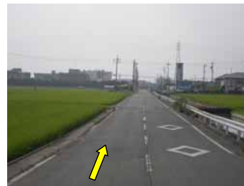
まっすぐ進み住宅展示場を過ぎると中島処理場入口です。