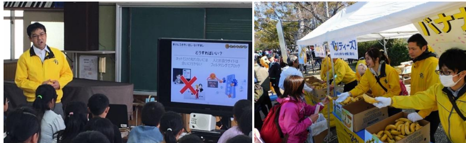
インターネット安心講座 出前授業