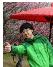
観光振興課(入庁3年目)

毎日仕事をしていると、「あれ、これ無駄じゃない？」とか「これ、もっとこうできるんじゃない？」と思うことがあります。その“気づき”を元に職場を“変える”。これが業務改善です。今年はどんな改善がされたのでしょうか？どんな仕事をしているのか知るのにも良いキッカケになると思いますよ♪