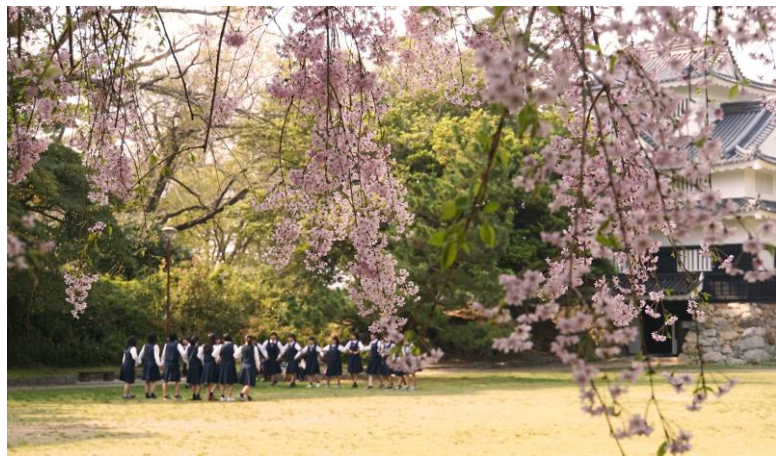
2018 グランプリ 「さくらに遊ぶ」 仲根英之様